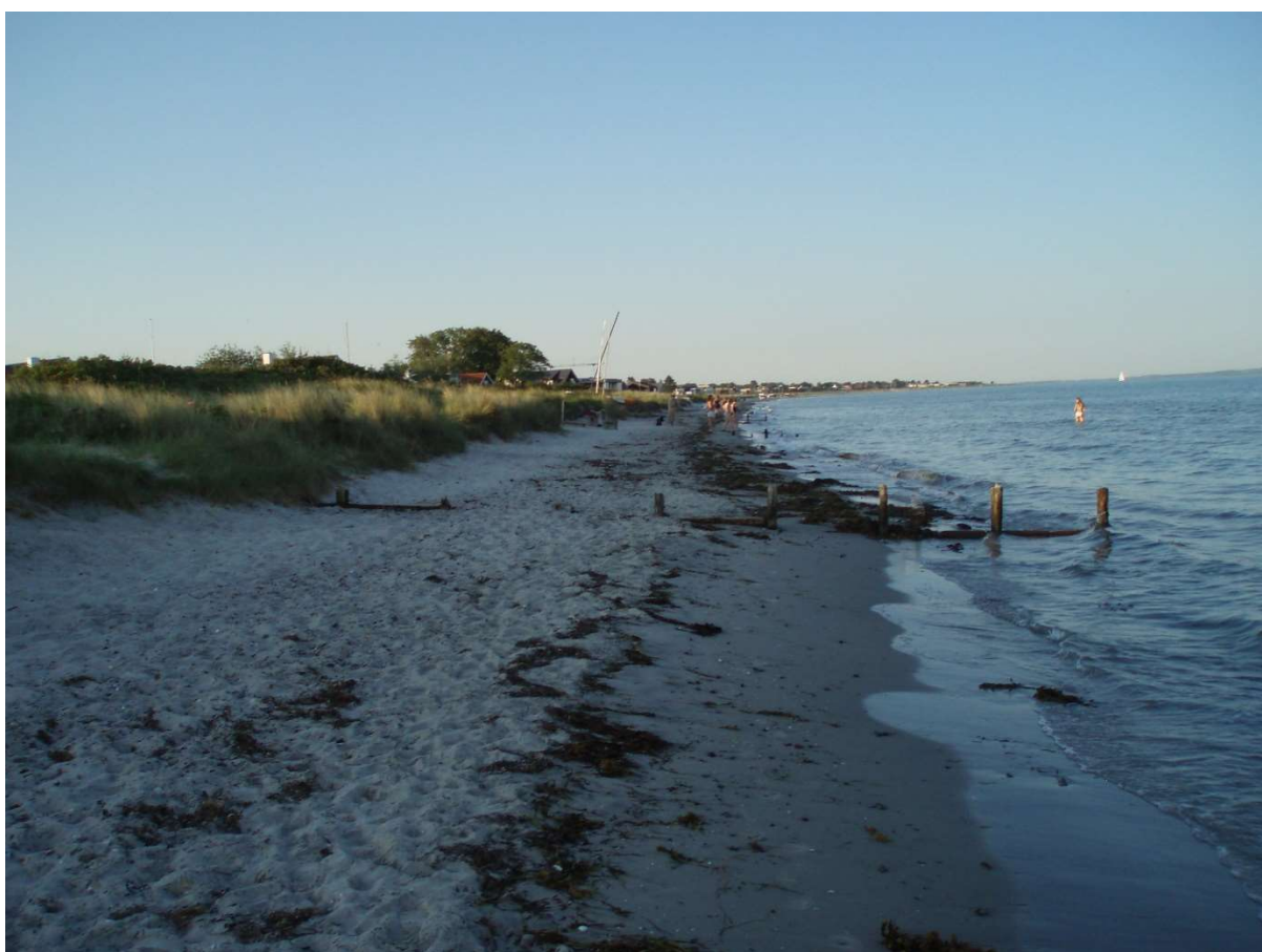
(7) Set udad fra Bellevue mod Themsvej og L.P. Bechsvej. Stranden lavere, i niveau som år tilbage sv. t. gl. høfder der er blottede, stranden er tilsvarende smallere.