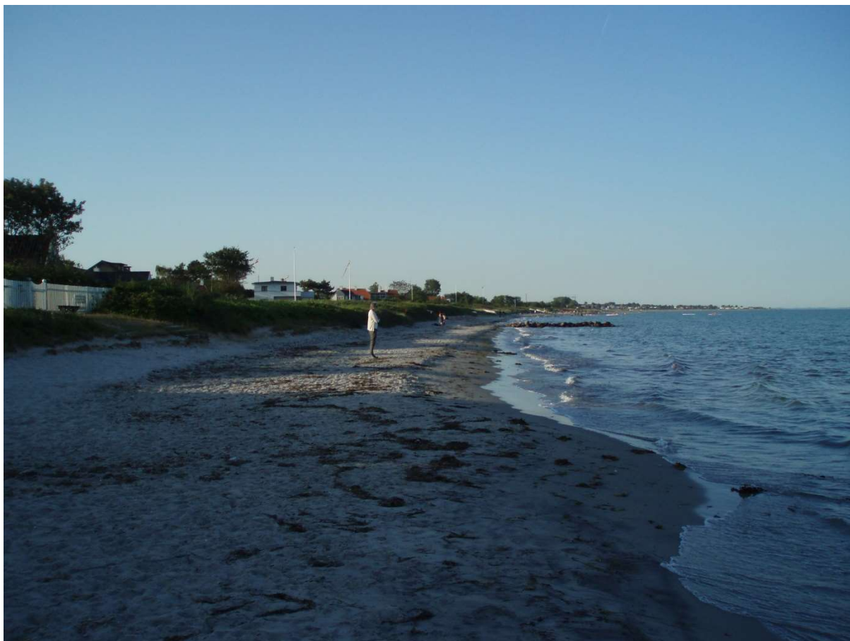
(3) Mellem Platanvej og Rønnevej, der er pæn høj strand dækket fint med sand