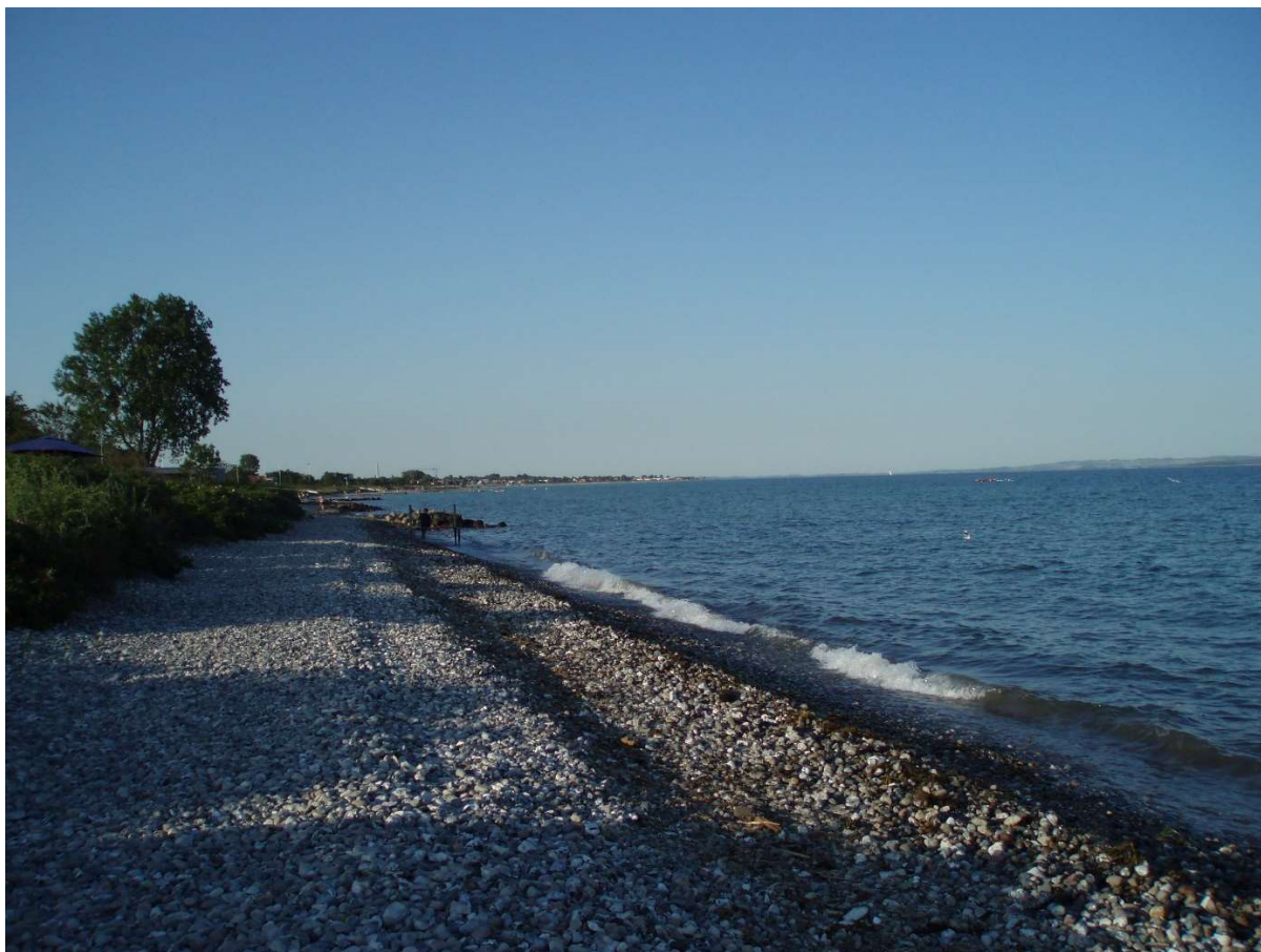
(1) Udfør Strandvænget set udad, Platanvejs stenkastning i baggrunden. Smal sandbræmme.