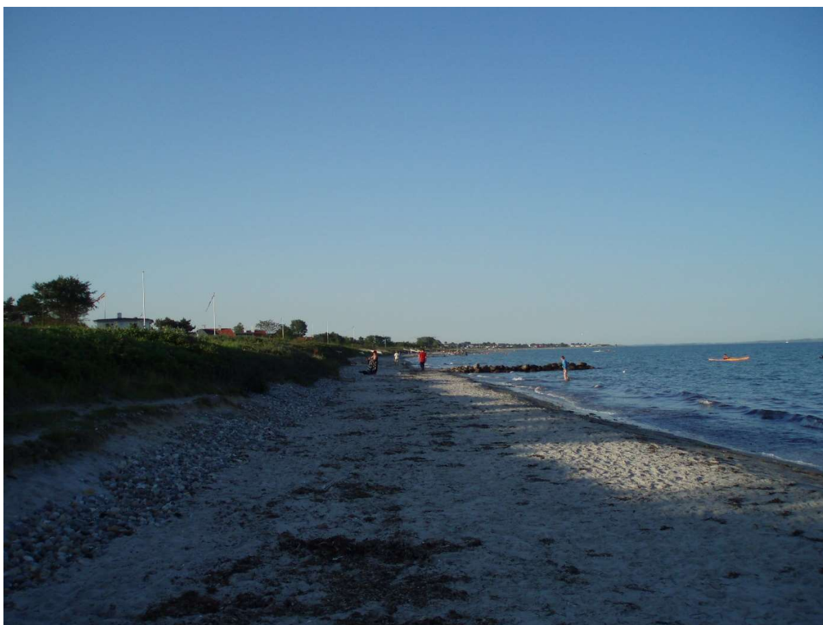
(2) Digefoden mellem Platanvej og Rønnevej blottet, men ikke eroderet, højere strand og skærvestore sten foran