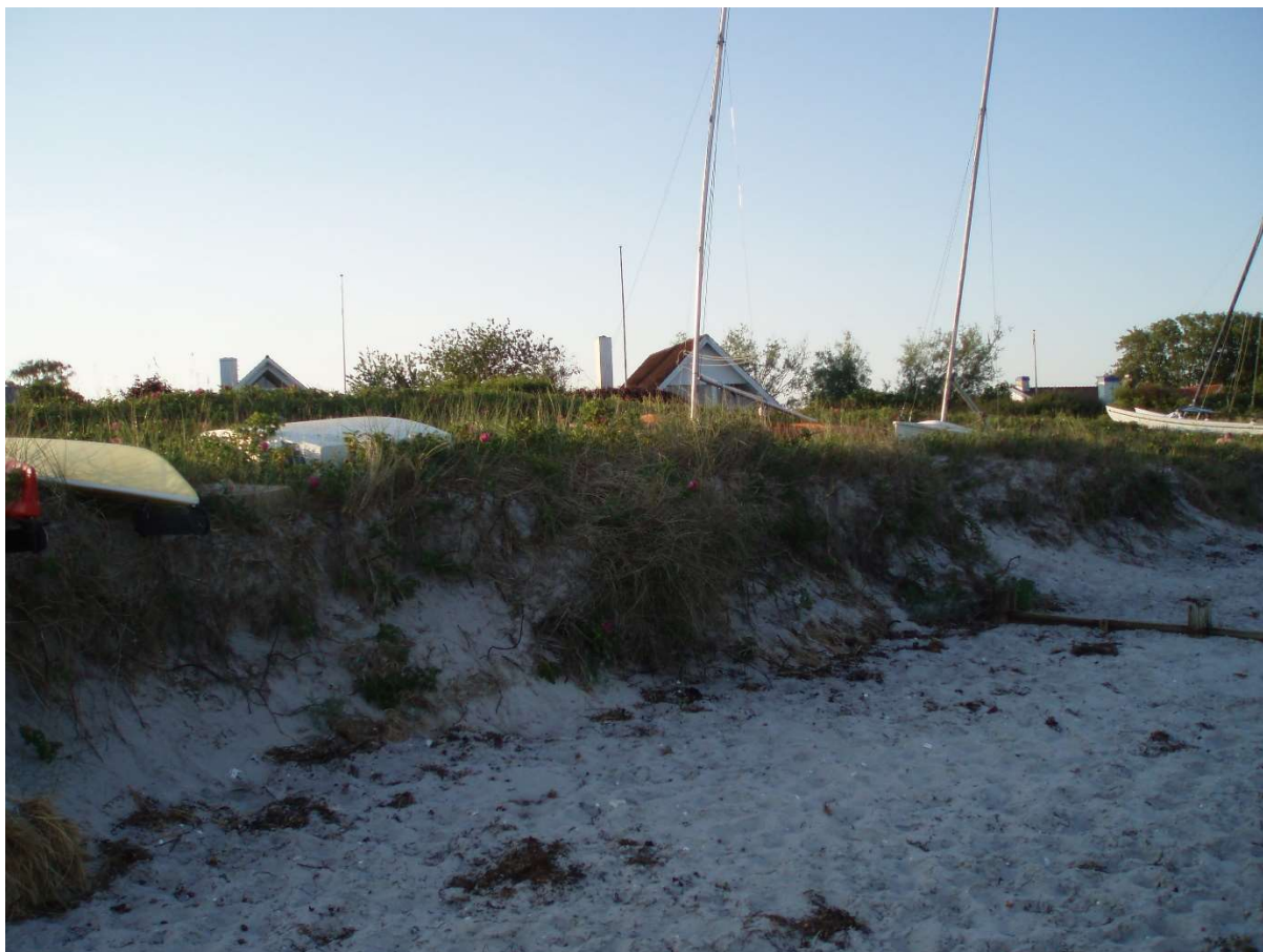
(6) Der er taget højde af den ydre strand, her set udad mod Themsvej. Skarp kant men god afstand til diget.