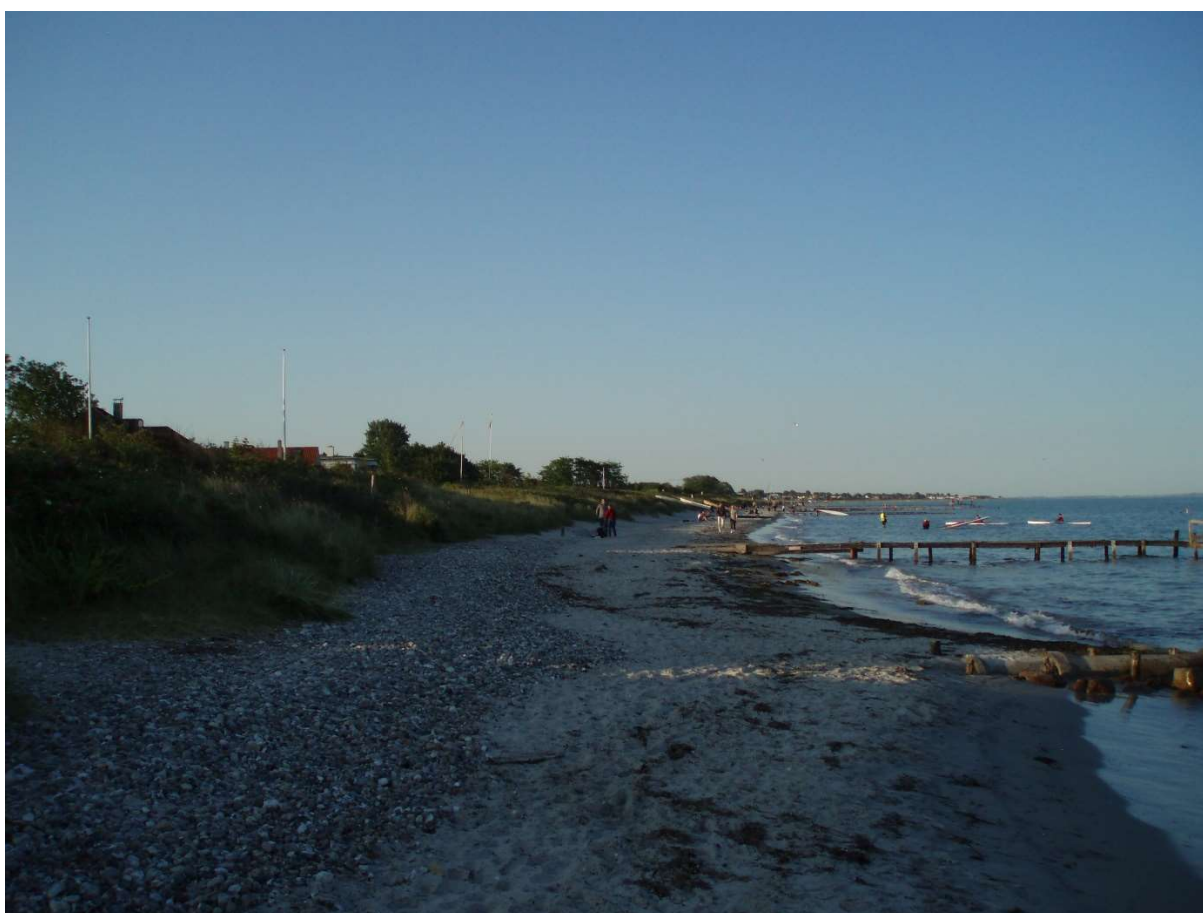
(5) Ahornvej. Læsideerosion spc. betinget af det store rør med stenkastning. Trods det pænt med sand.