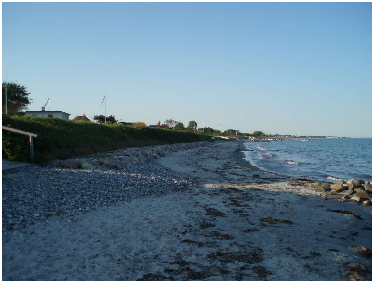
(4) Rønnevej med stenbeskyttelse for diget. Der er kommet bredere og højere sandstrand, vandstand +12 cm DVR 90